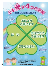
(ア) で使用するポスターの例