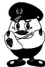
埼玉県警察マスコット 「ポッポくん」