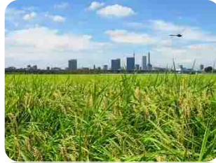
都市と自然の調和