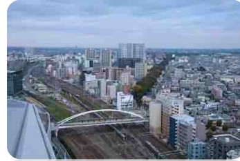
市内に9路線31駅ある鉄道のまち