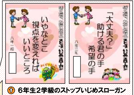
① 6年生2学級のストップいじめスローガン

「またあした えがおのともだちが まっている」 「ぼくたちは いじめを止める ヒーローだ」 「えがおはね しあわせつくる たからもの」 「思いやる 心をもてば いじめゼロ」 「ふわふわことば みんなにっこり えがおになる」