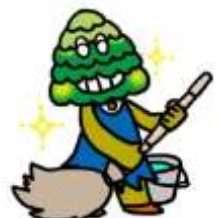
📌 ぞうきんで便器をみがく6年生の掃除

トイレを毎日自分たちで掃除をすることで、きれいになったし、臭わなくなっってうれしい！