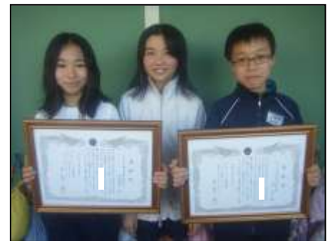
代表で表彰を受けた6年生3名

3名の6年生は「ただみんなで落ち葉拾いをしただけなのにこんなにも立派な賞状を頂けるなんて…」と前置きした上で、「この活動が下級生にも広まってくれたら嬉しいです。」と話しました。